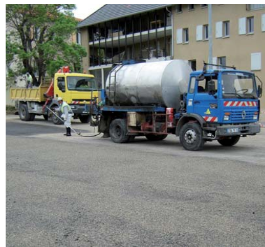
Nouveau parking du centre ville