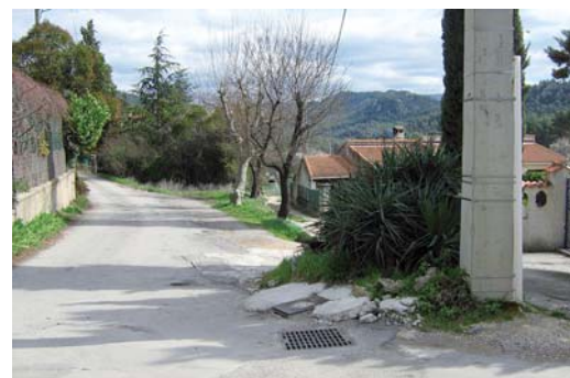
Entrée chemin du Cercle