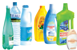
Bouteilles en plastique