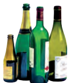
Bouteilles en verre