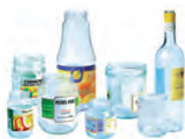
Bocaux de confiture, yaourts, flacons en verre