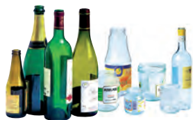
1 tonne de verre