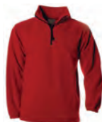
1 pull polaire