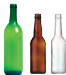
2 500 nouvelles bouteilles