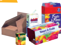
Briques alimentaires, cartons, cartonnettes