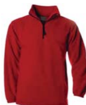
1 pull polaire