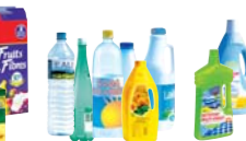
Bouteilles en plastique