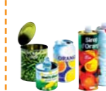
boîtes en métal, canettes et aérosols