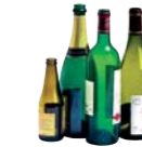
bouteilles en verre