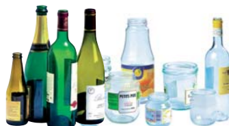
1 tonne de verre