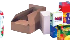
briques alimentaires, cartons, cartonnettes