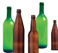
2 500 nouvelles bouteilles